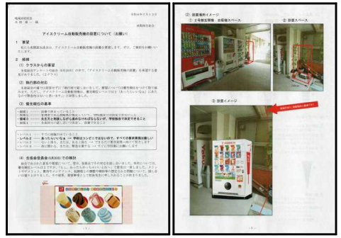
『アイスクリーム自動販売機の設置要望書』